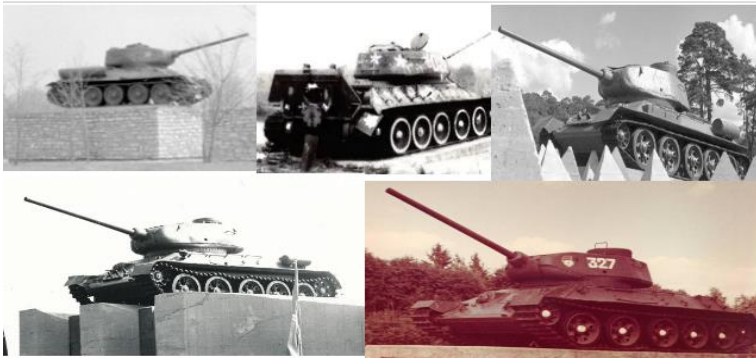
Ülal Narva-Mäksa-Pärnu ja all Võru-Valga

32. Tank-monumente püstitati Eestisse 5: Pärnusse (1969 a), Võrru (1979), Valka (1978), Narva (1969) ja Mäksa valda (1984). Millised kaks neist on senini töökorras? Üks neist osales isegi filmis “1944”, kus see pööras Saaremaal läbi kiviaedade ja talude. Kaks õiget – 2p, üks nimi – 1p.