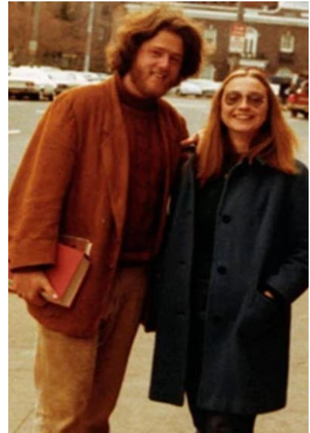
Pildil koos tulevase abikaasaga aastal 1971

Nimetage ka kirjanikuna "mehetegusid" teinu, sedapuhku eesnimega?