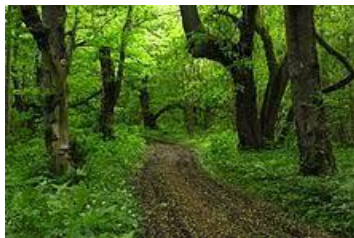
12. 200-aastane pärnamets Abruca saarel