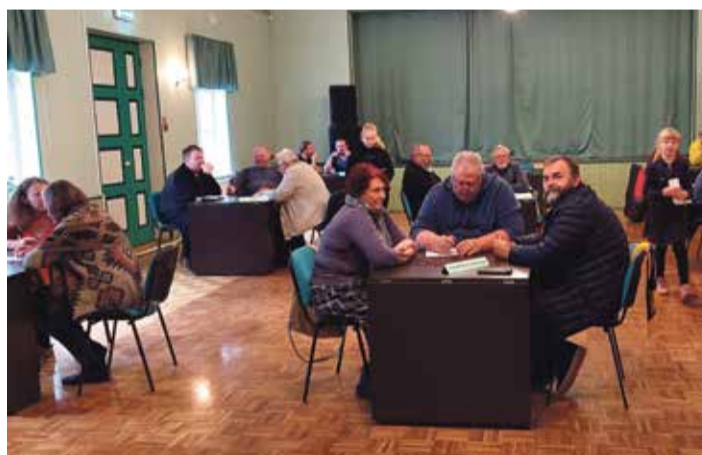
Iisaku rahvamajas toimus mälumäng.