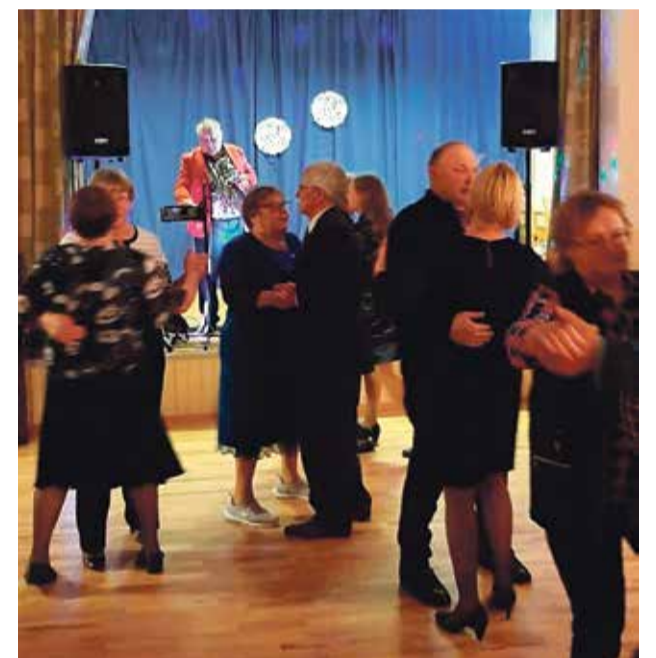
Tantsuõhtu Pagaril.