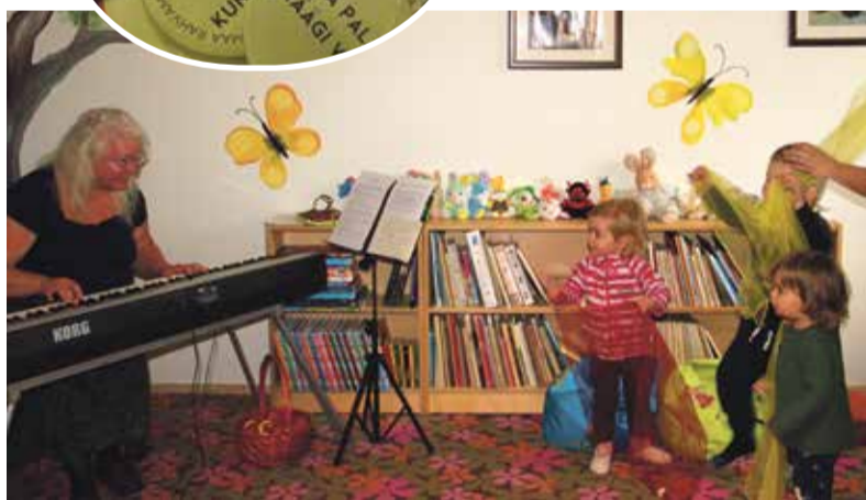
Muinasjutu- ja muusika hommik Mäetagusel.