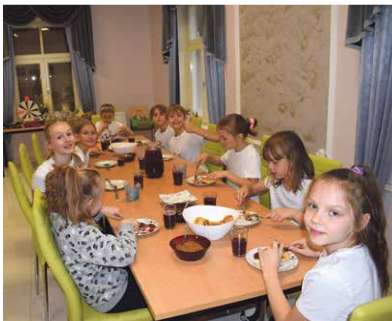
Kurtna seltsimajas sai muude tegemiste hulgas pannkooki süüa.