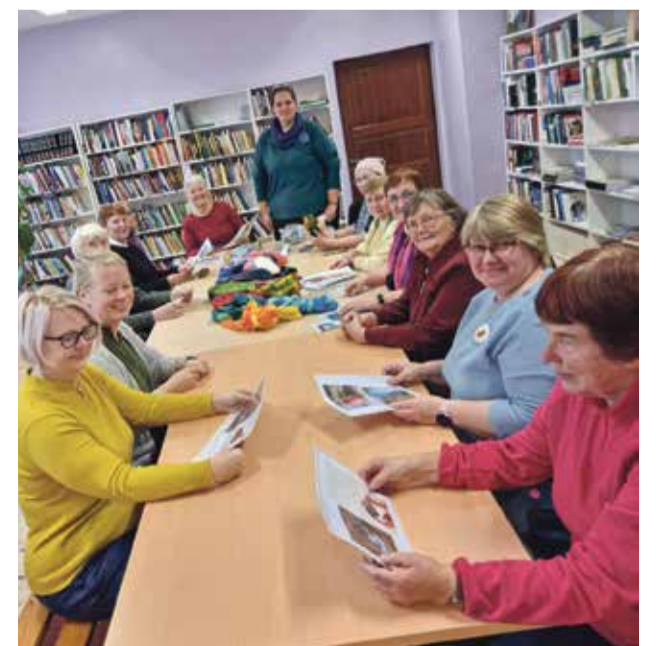
Tudulinna kogukonnajamajas sai valmistada vildist ehteid.