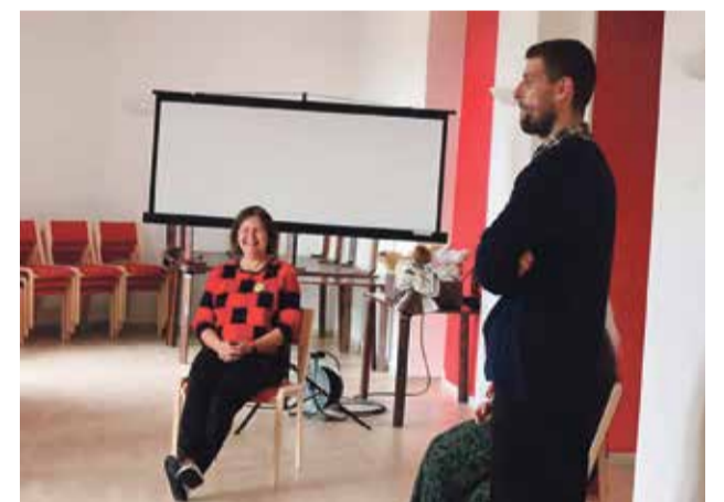
Kiiklas mänguhoos.