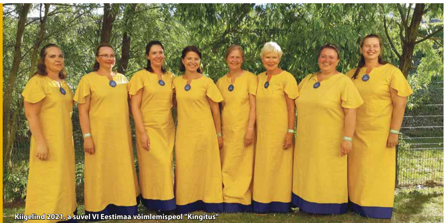
Kiigelind 2021. a suvel VI Eestimaa võimlemispeol "Kingitus"

Võiks ju arvata, et 10 tegutsemisaastat ei ole ühe rahvakultuurikollektiivi jaoks teab mis vanus. Neile, kes koos tantsivad, on see olnud pikk ühine tee, täis toredaid elamusi ja selgeks saadud tantsusamme. Kiikla rahvatantsu naisrühmal Kiigelind on olnud palju põnevaid esinemispaiku. Esinetud on kodus ja võõrsil, sealhulgas ka Lätis ja Soomes, mõisapargis, sadamas, jalgpallistaadionil, isegi rabas ja veel paljudes teistes huvitavates kohtades. Nüüd kutsub Kiigelind kodusse saali Kiikla rahvamajja vaatama oma sünnipäevakontserti, kus koos rahvamaja näiteringiga on valmis saanud tantsuetendus „Muinasjutt kiigelinnust“. See lõbus ja lüüriline lugu räägib Eesti muinasjuttudest tuttavate tegelaste kaudu loo tantsurõõmu leidmisest. Ja kui tantsurõõm leitud, kutsutakse ka vaatajad tantsima, algul ühistantsule koos Kiigelindudega ja hiljem juba simmanile ansambliga Tuulebant.