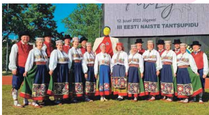
Avitaguse tantsurühm III Eesti naiste tantsupeol.