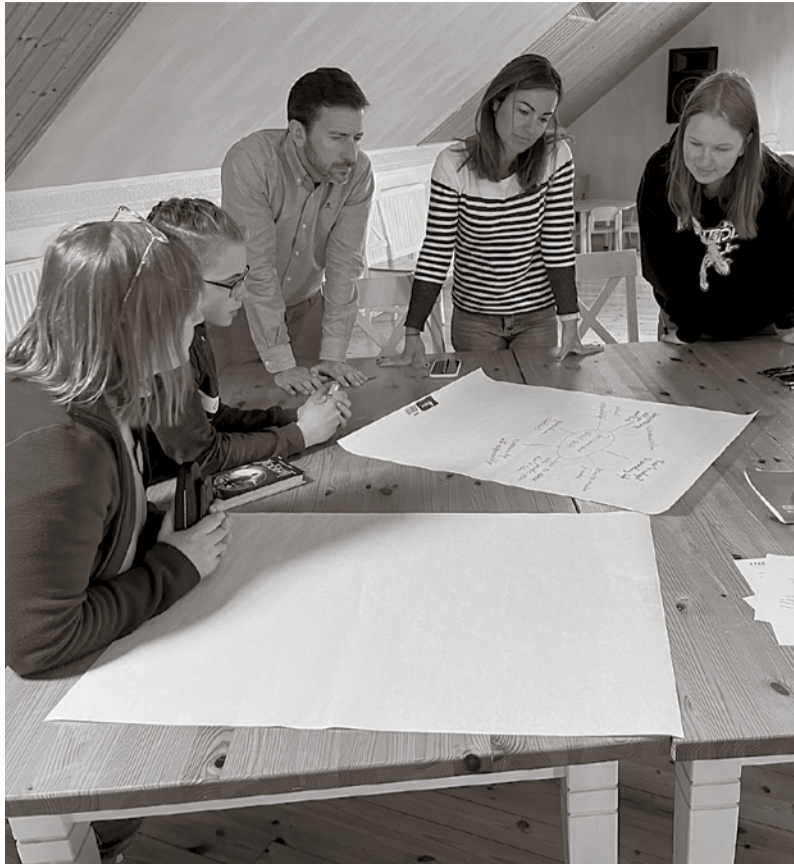
Illuka õpilased kaardistasid projektipartneritega milliseid teadmisi ja oskusi võis tulevikus tarvis minna.