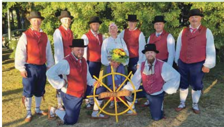
Avitaguse mehed.