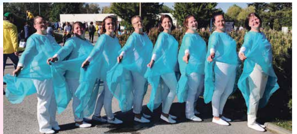
Kiigelinnu naised võimlemispeol esimest suvepäikest püüdmast.

Et Kiikla naisrahvatantsurühm Kiigelind tähistas kevadel rühma 10. juubelit kontsert-etendusega „Muinasjutt Kiigelinnust“, siis sel aastal toimunud III Eesti Naiste tantsupeole minekut plaani ei võetud. Mõned tantsud rahvatantsupeo repertuaarist õpiti küll selgeks, kuid otsustati hoopis osa võtta juuni alguses toimunud XXII Tallinna võimlemispeost „Aeg unistada“. Nimelt on Kiigelinnu naised rahvatantsijana pidudel osalemise võrratu tunde kõrval avastanud ka võimlejana osalemise omamoodi võlu.