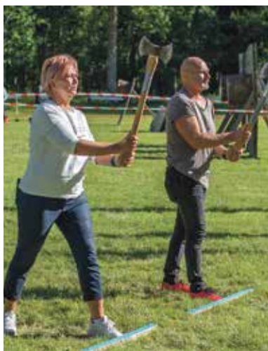
Võistlus „Võim versus rahvas“ – valla töötajate esindajad

Mõisapäev möödus taas täis tantsu, teatrit, sporti, pillimängu ja head muusikat. Loodame, et mõisapäev oli toredate kohtumiste paigaks ka sellel aastal. Suur tänu kõigile, kes mõisapäeva kordaminekuks oma panuse andsid!