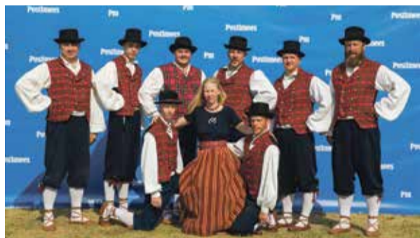
Iisaku mehed Meeste tantsupeol.