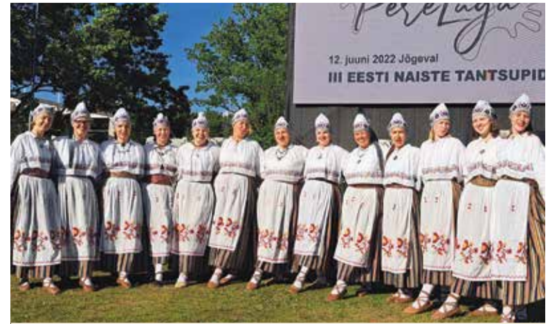
Sigin-Sagin III Eesti naiste tantsupeol.

Olen pikalt mõtisklenud selle üle, mis kannustab rahvatantsijat. Mis innustab õppima ja harjutama kellegi teise poolt välja mõeldud koreograafiat? Miks joonduda või reastuda? Mis ajendab tantsijat püüdlikkusele, paremale sooritusele, õnnestumisele? Kuidas ning millal tekib „meie“ tunne? Millal ja mis tingimustel me saame olla oma soorituse ja tegutsemise üle uhked?