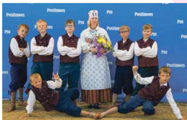
Iisaku poisid Meeste tantsupeol.

Meeste tantsupeo suurel väljakul oli tantsida kõige väsitavam, kuid seal oli väga lõbus. Seal oli väga palav. Mulle meeldis, et ma olin koos sõpradega. Sain nendega mängida.