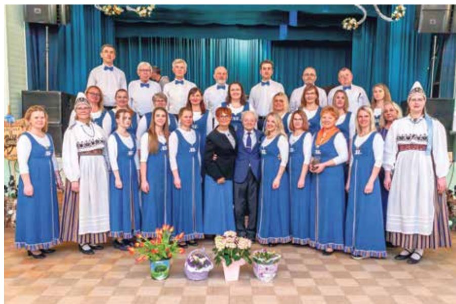
Oonurme segakoor.