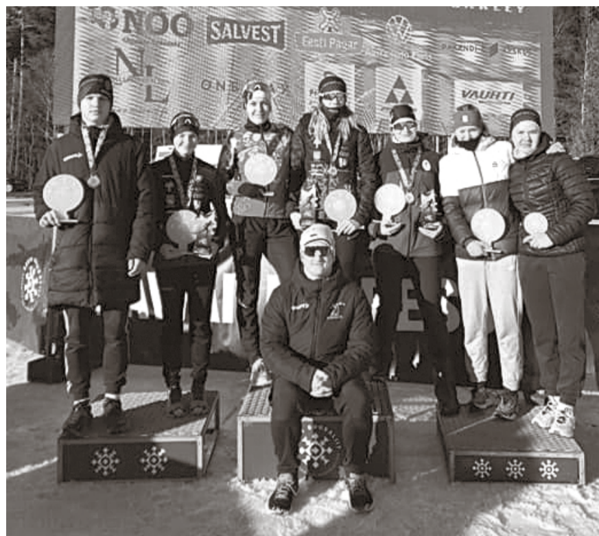
Alutaguse suusaklubi.