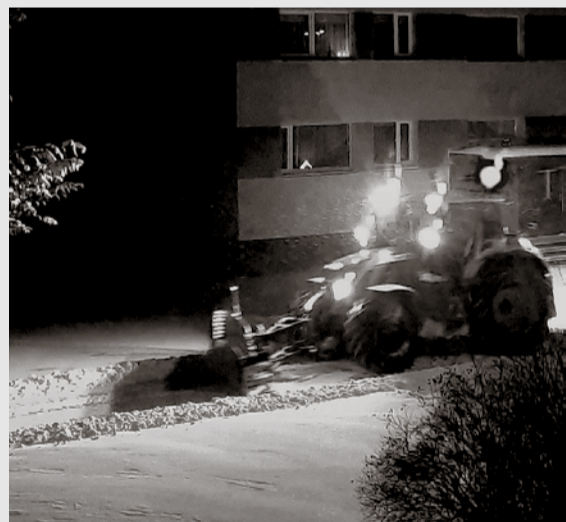
Эта движущаяся и сверкающая огнями «елка» виртуозно проходит и по всем внутренним дорогам поселка. Иногда, если время подходящее, даже в сопровождении музыки.

За бытовыми хлопотами можно не заметить приближение праздника, однако когда рядом с твоим домом проходит такая техника, ясно понимаешь — скоро Рождество!