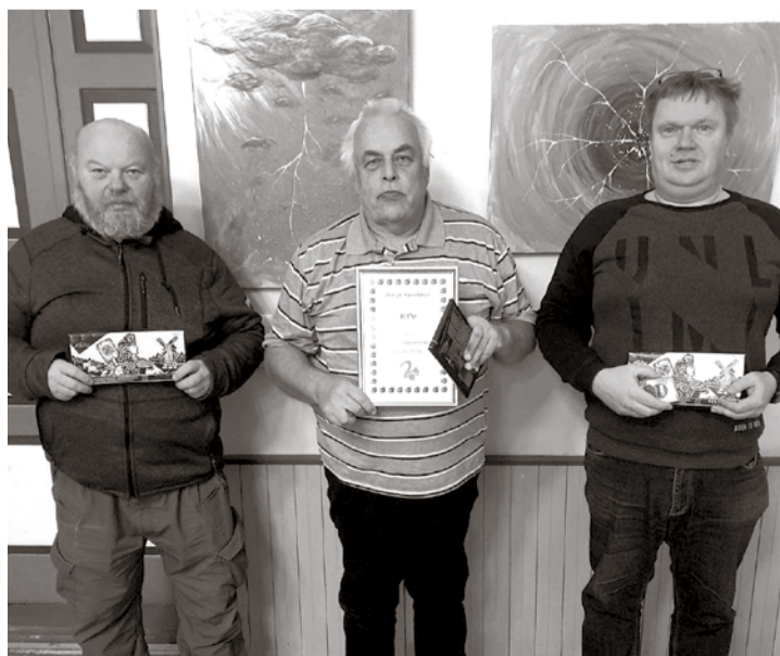
Võistkond KTV.

Praeguses vormis mälumängudega alustasime aastal 2004, tänaseks on alguse juures olnud alles kunstide kooli, rahvamaja, perekond Armi ja gümnaasiumi võistkonnad (viimane